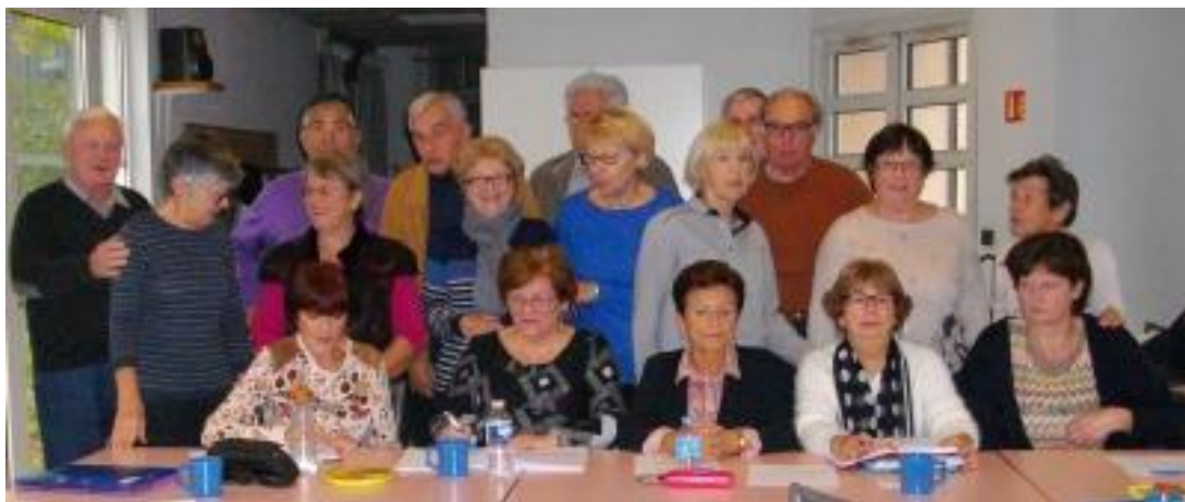
Le CA presque au complet

Sachez que chaque activité à laquelle vous participez a demandé en amont énormément de travail aux bénévoles ; ils le font toujours avec plaisir et votre satisfaction est leur plus grande récompense !