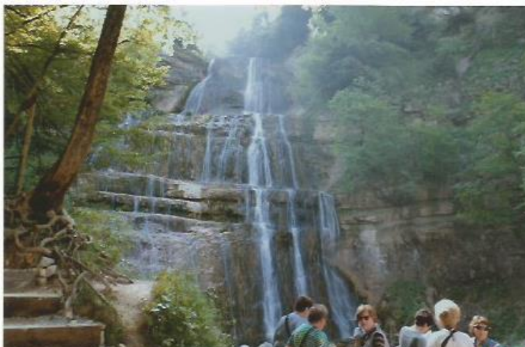
Les Cascades du Hérisson : chute d'eau de l'Eventail - 65 m de haut