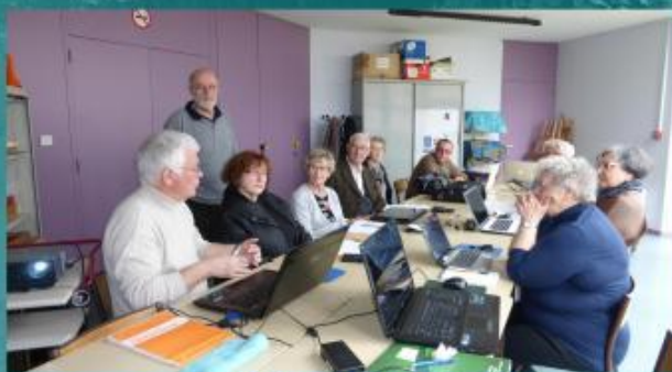
ATELIER de GENEALOGIE