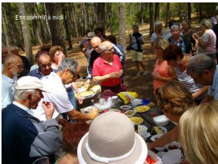
Une sortie en juillet à Arès