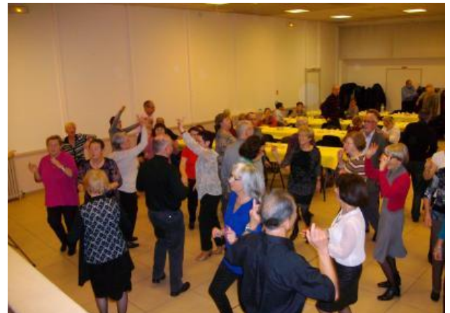
En Janvier, promeneurs et randonneurs se sont retrouvés pour partager la galette en dansant